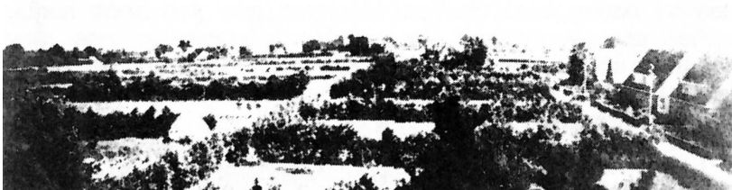
De tuinen waren omringd door elzehagen.

De tuinen waren door de hagen verdeeld in vakken of hoeken zoals ze hier genoemd werden. Ze waren heel verschillend van grootte bv. 50 tot 200 Rijnlandse roede (1 R.r. = 3,7674 m. of 14,19 m 2 ; 1 ha. (bunder) = 704 R.r.).