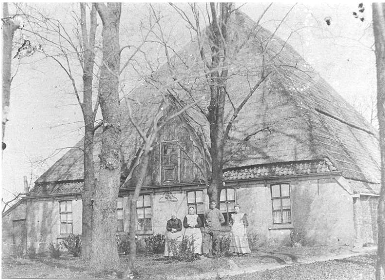
Een boerderij die in de Nederlandse literatuur een (kleine) rol heeft gespeeld.

Uit "Het boek der Opschriften", door Mr. J. van Lennep en J. ter Gouw (Leiden 1868) blz. 206: Bijbelsche Opschriften.