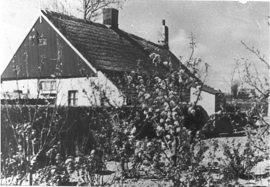
In een huisje als dit vond deze geschiedenis plaats.